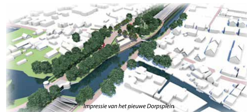
Impressie van het nieuwe Dorpsplein

Sinds november 2016 werkt de Dorpsraad Broek in Waterland samen met de provincie Noord-Holland om het plan van de Dorpsraad voor een onderdoorgang tot schetsontwerp uit te werken. Aan het eind van dit jaar maken we een tussentijdse balans op van deze co-creatie. Er liggen nu vier varianten voor een ondergrondse en één voor een bovengrondse oplossing op tafel waaruit de provincie in de loop van 2018 een keuze zal maken. Wordt het onderdoor of toch bovenlangs?